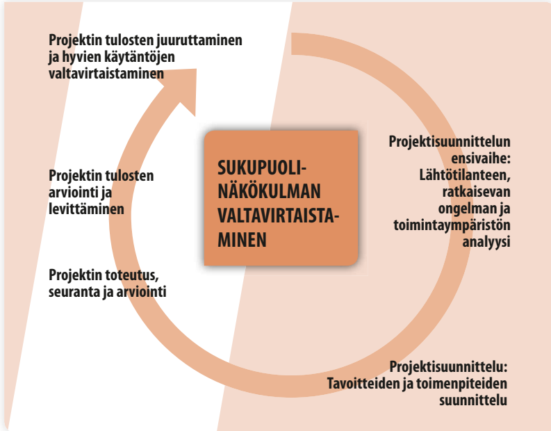
KUVIO 3: Sukupuolinäkökulman valtavirtaistaminen projektin elinkaaren kaikkiin vaiheisiin. Mustakallio ja Tanhua 2011.

Sukupuolinäkökulman merkitystä on arvioitava projektin kaikissa vaiheissa. Arviointitiedon perusteella projektin tavoitteet, toimenpiteet ja niiden toteuttamistavat suunnitellaan niin, että niillä edistetään sukupuolten tasa-arvoa. Sukupuolinäkökulma on otettava huomioon myös projektin seurannassa ja arvioinnissa sekä tiedottamisessa ja hyvien käytäntöjen levittämisessä ja juurruttamisessa.